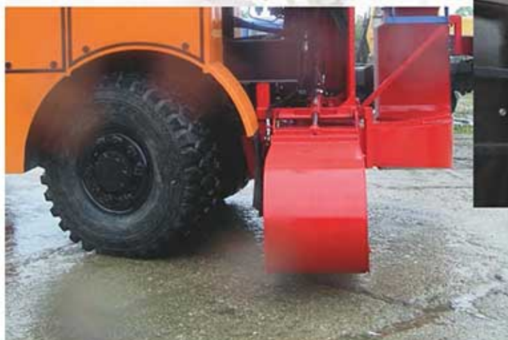
Доворачивающееся заднее колесо